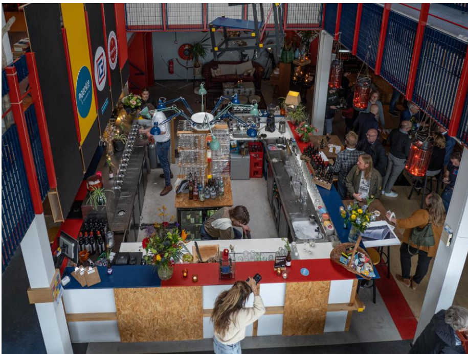
Afbeelding 6: Opening Rietveldkerk Uithoorn.