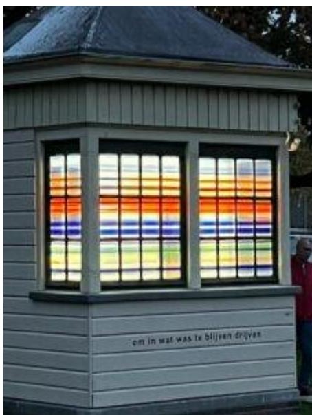
Afbeelding 4: verlicht Brugwachtershuisje met gedicht van project SPOT ON! Brugwachtershuisjes.

Naast de projectbijdragen vanuit ontvangen donaties en overige inkomsten, heeft de stichting in 2022 voor € 93.508 (2021 € 77.727) geormerkte projectbijdragen ontvangen. Dit betreft bijdragen en schenkingen waarbij de gever het project heeft benoemd waarin de bijdrage moet worden besteed. Dit betreffen de volgende projecten: