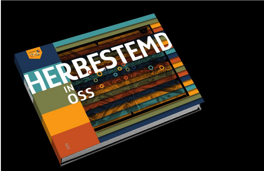
Afbeelding 2: publicatie Herbestemd in Oss .