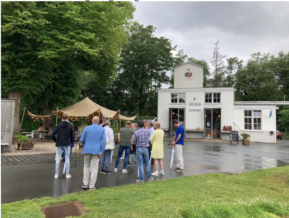
Afbeelding 7: Vriendendag in Veenhuizen.