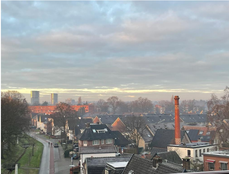
Afbeelding 1: schoorsteen voormalige wasbeitsfabriek in Apeldoorn.