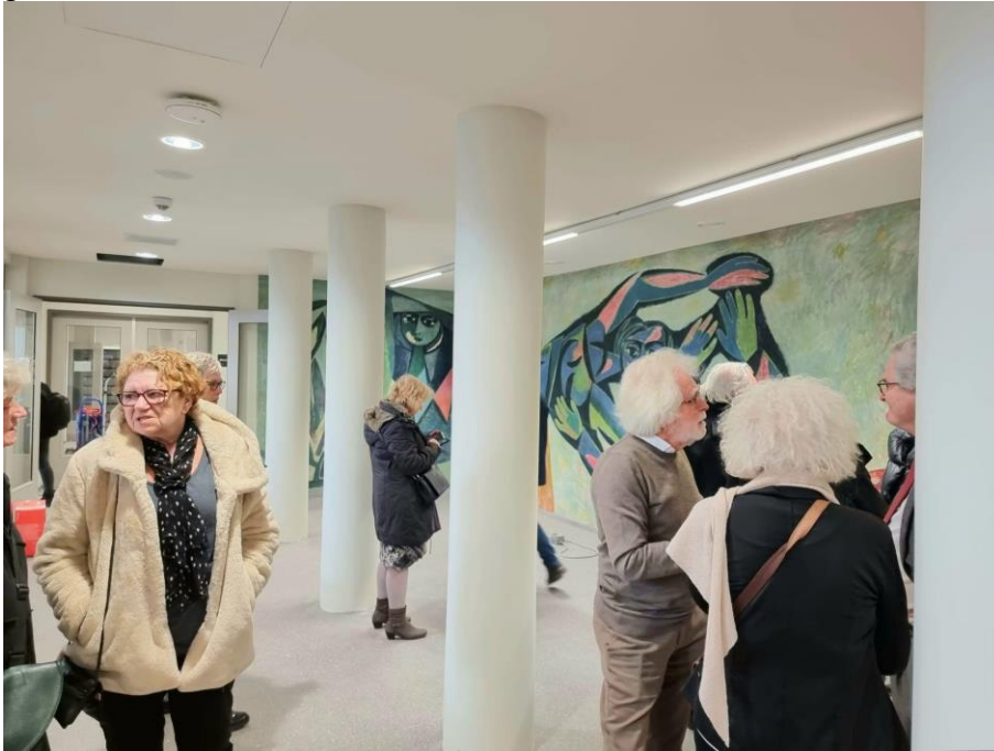
Afbeelding 5: Vriendenrondleiding Zuiderziekenhuis Rotterdam.