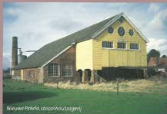
Nieuwe Pekela, stoomhoutzagerij

AANMELDING ALS DONATEUR SIEN-N Als donateur geeft u jaarlijks een (voor de belasting aftrekbaar) bijdrage. Van dat geld worden activiteiten georganiseerd en publicaties verzorgd. Donateurs krijgen een uitnodiging voor de jaarlijkse SIEN-N-excursie. Donaties kunnen worden gestort op Postbank 5597042, t.a.v. SIEN-N Groningen, o.v.v. 'Donatie/ jaartal'. Donaties particulieren € 15,- per jaar. Donaties bedrijven/instellingen € 50,- per jaar. Reageer nu en word donateur door inzending van de antwoordkaart.