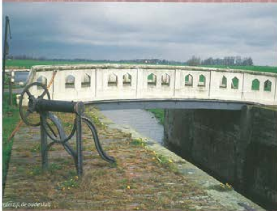
De Oude Sluis

De stichting Industrieel Erfgoed Noord-Nederland is aangesloten bij de Federatie Industrieel Erfgoed Nederland (FIEN). SIEN-N beschikt over een eigen website ( www.sien-n.nl ), waarop u informatie over de stichting kunt vinden. Ook is op de website een selectie te vinden van meer dan honderd voorbeelden van industrieel erfgoed in Noord-Nederland.